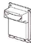
Panel pionowy PA191